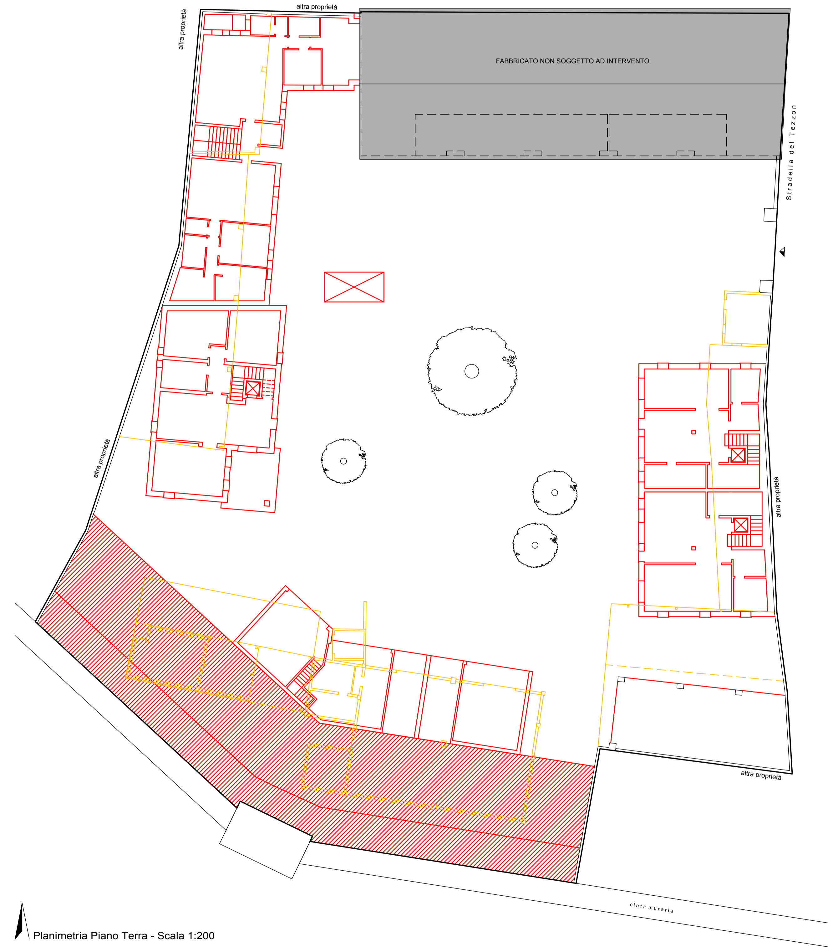
Planimetria Piano Terra - Scala 1:200